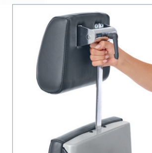
Kopfstütze Ergo als Standard kann handlich getauscht werden.