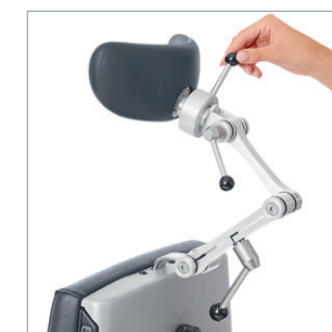
Jede Position mit Kopfstütze Ergo, Halb- oder Vollkalotte fixierbar