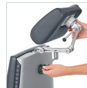
Schnelle und handliche Positionierung – einzigartige Gelenkfixierung