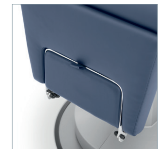
Fußstütze klappbar, optisch perfekt ins Beinteil integriert