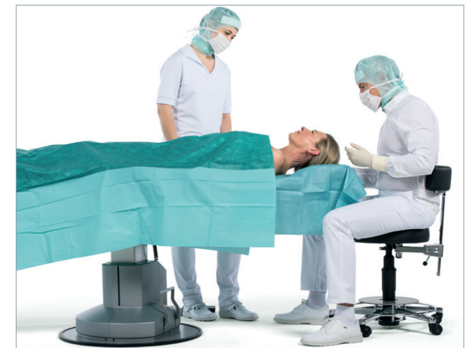
Behandlung und OP in Flachlage, sitzend in 12-Uhr-Position