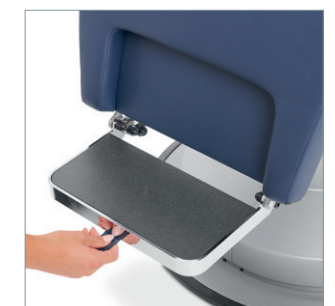
Bei Synchronverstellung bewegt sich die Trittplatte ergonomisch mit