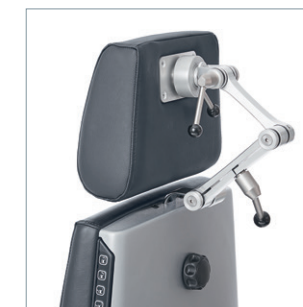
Kopfstütze Ergo mit Vario-Doppelgelenk und Quick Assist Kupplung